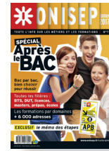
Collection Dossiers Après le BAC 2017