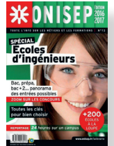
Collection Dossiers Ecoles d'ingénieurs