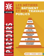
Collection Parcours Les métiers du bâtiment et des travaux publics